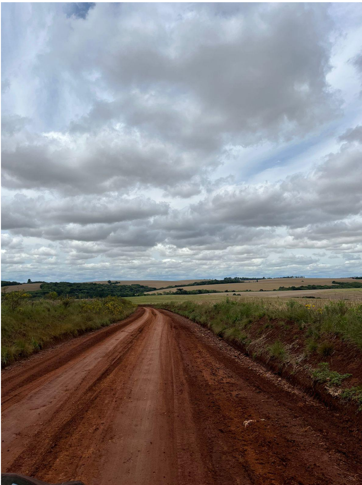
Imagens ilustrativas da situação atual do local: Estrada de Acesso ao Distrito de Sagrisa Coordenadas Geográficas: Latitude: 28°02'50.7"S Longitude: 52°38'04.1"W